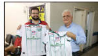
Médicos recebem camisa do time como forma de agradecimento pelo atendimento prestado ao atleta