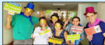
Membros da Cipa do Huapa fantasiados para alertar colaboradores sobre proibição ao uso de adornos

Amparados pela Norma Regulamentadora 32 (NR-32), os colaboradores responsáveis pela fiscalização utilizaram máscaras, chapéus e placas para chamar a atenção dos profissionais que faziam o uso indevido de acessórios. Os profissionais que foram encontrados utilizando adornos foram advertidos imediatamente e orientados a retirar os objetos.