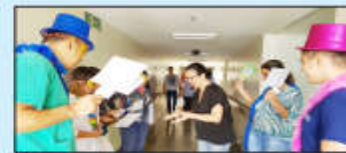
Profissional mostra para "agentes da blitz" que segue a norma e está sem acessórios

cumprir a NR-32 está sujeito a notificação verbal, duas advertências por escrito, suspensão e até a perda do cargo, conforme preconiza a Ordem de Serviço da unidade, que fica disponível no Serviço Especializado em Engenharia de Segurança e em Medicina do Trabalho (Sesmt). Há também a previsão do pagamento de multa para o Ministério do Trabalho que pode variar de R$ 800,00 (oitocentos reais) a R$ 3.302,14 (três mil, trezentos e dois reais e quatorze centavos).