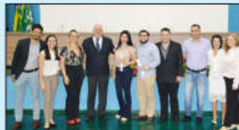
Formandos com diretores e médicos do Huapa na SEST-SUS

Durante discurso no Cremego, o coordenador da Comissão de Resi-