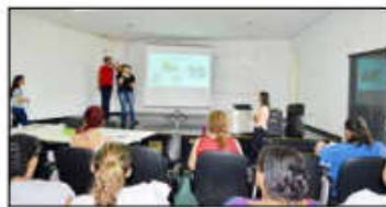
Colaboradores participam do lançamento do programa 'Peso Certo' do Huapa

"A nossa meta é atingir o maior número possível de participantes e