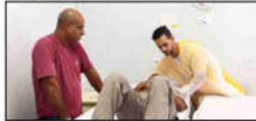
Maqueiros recebem capacitação para atender pacientes com ainda mais excelência

Para aprimorar ainda mais o atendimento aos pacientes do Huapa, o hospital realizou uma capacitação nos dias 7 e 8 de junho voltada para os maqueiros do hospital. Durante o encontro promovido pelos setores de Fisioterapia, Serviço de Controle de Infecção Hospitalar (SCIH), Núcleo de Segurança do Paciente (NSP) e pelo departamento de Recursos Humanos do Instituto de Gestão e Humanização - Organização Social (OS) gestora da unidade, foram debatidos temas como qualidade e humanização no atendimento; relacionamento interpessoal; higienização das mãos; segurança do paciente; e orientações práticas sobre transporte e transferência de pacientes.