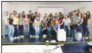
Gestores e coordenadores participam de palestra sobre saúde mental no auditório do Huapa

Durante a palestra a psicóloga realizou uma dinâmica em grupo, visando suscitar situações no ambiente profissional que impactam diretamente em sua saúde mental e física, desper-