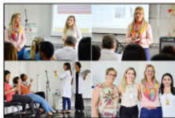
Campanha Abril pela Segurança do Paciente e realizada

As equipes do Núcleo Interno de Regulação (NIR) e Recepção receberam um treinamento seguindo a temática,