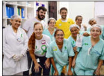
As equipes foram até os postos de trabalho alertar os colaboradores.

O Sesmt do Huapa promoveu entre os dias 15 e 22 de abril, o “Abril Verde”, campanha criada para conscientizar os colaboradores contra os acidentes de trabalho. A equipe desenvolveu atividades nos postos de trabalho e exibiu vídeos com depoimentos de colaboradores do Huapa, que sofreram algum tipo de acidente de trabalho. “Nosso intuito não é punir. É educar e mostrar, de forma descontraída, que um simples deslize pode se tornar algo muito sério para o trabalhador”, explicou a colaboradora do