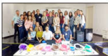
Líderes e gestores do Huapa participaram da dinâmica