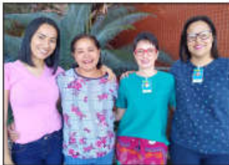
Equipe do SCIH do Huapa

preenchimento do formulário é a certeza que estes números serão revertidos em ações de prevenção e controle contra as infecções nos serviços de saúde e segurança no cuidado ao paciente, salvando vidas. Esta que, sem dúvidas, é nossa grande visão”.