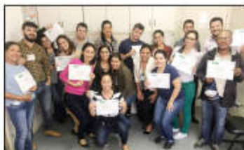
Os novos cipeiros posam com seus certificados

dos nos dias 4 e 7 de junho, com uma extensa programação de palestras que abordaram as normas regulamentadoras da Cipa; regimentos acerca da segurança e saúde no trabalho em serviços de saúde; utilização de equipamentos de proteção individual (EPIs); inspeções e investigação de acidentes; programa de Prevenção de Riscos Ambientais