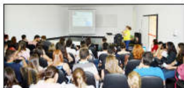
Acolhimento de novos alunos no Huapa

A Comissão de Ensino e Pesquisa (CEP) do Hospital Estadual de Urgências de Aparecida de Goiânia Cairo Louzada (Huapa) acolheu novos alunos de diversas instituições de ensino nos dias 5 de agosto e 31 de julho, para o segundo semestre de atividades de estágio, obrigatórias na grade curricular. Acadêmicos de Medicina, Farmácia e Nutrição passarão os próximos meses de sua especialização dentro da unidade, aperfeiçoando seus conhecimentos. Ao todo, 54 novos alunos foram recebidos, sendo 19 da Universidade de Rio