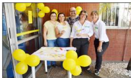
Equipe do Huapa durante a ação do Setembro Amarelo

Na entrada da recepção administrativa, a equipe abordou quem ali passava e deles ouviram relatos sobre a importância de se falar sobre o tema. “Ouvimos muitas histórias de pessoas que tentaram se matar, sejam familia-