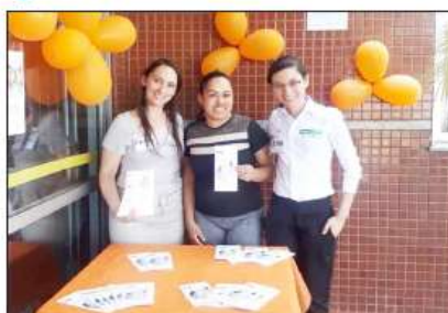
NSP entregou material explicativo aos acompanhantes

Já na parte da tarde, no horário de visita, foram distribuídos materiais informativos, que destacaram o papel importante que eles podem ter para contribuir na prevenção de quedas.