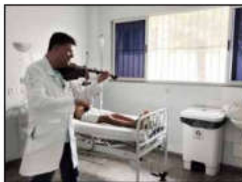
O músico levou melodias por todos os setores do Huapa

O projeto já existe há quatro anos nos hospitais de Minas Gerais. Depois de ver o sucesso nestas unidades de saúde, a empresa decidiu trazer o músico para os hospitais nos quais presta serviço em Goiás. "Eu percebi que esse trabalho beneficia a todos que ouvem, pois trago o contraponto para a agitação