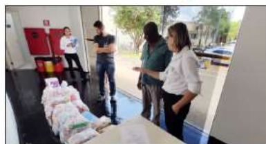
Equipe multiprofissional durante a entrega das cestas, no Huapa