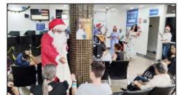
O Papai Noel alegrou os presentes na tarde do dia 10

O grupo passou pelas áreas assistencial e administrativa, cantando músicas natalinas e distribuindo bombons. No dia 17, foi realizado um culto ecumênico, com a presença de ministrantes das religiões evangélica e católica. Durante o evento, cânticos de alegria e amor para lembrar o verdadeiro espírito do Natal foram entoados pelos presentes.