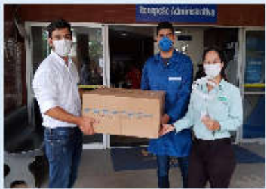
Entrega de máscaras Face Shield, que vão ajudar na proteção aos colaboradores

O Hospital Estadual de Urgências de Aparecida de Goiânia Cairo Louzada (Huapa) recebeu a doação de 100 protetores faciais da Faaftech, uma indústria de soluções automotivas de Goiás. Com o objetivo de contribuir para o combate ao coronavírus, a empresa desenvolveu, de forma voluntária, o Face Shield, um protetor facial de fácil fabricação e de baixo custo, seguindo todas as orientações dos órgãos de saúde competentes.