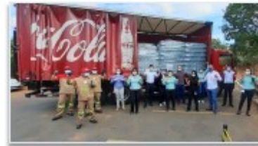
Colaboradores do Huapa e representantes da Coca-Cola Bandeirantes reunidos na entrega

cho. Cada funcionário do Huapa levou para casa um fardo de garrafas de água mineral, contendo 12 unidades. A gratidão pelo gesto ficou evidente no momento da entrega.