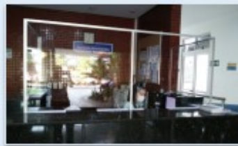
Assim como na recepção, as placas foram instaladas em vários pontos da unidade

A ação faz parte de diversas medidas protetivas e preventivas que o Huapa tem tomado, para evitar a disseminação do novo coronavírus.