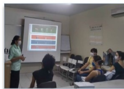
Os alunos conheceram a rotina do Huapa

O Departamento de Ensino e Pesquisa (DEP) do Huapa retomou, no início de junho, as atividades de Estágio e Internato de Medicina, paralisadas devido à pandemia do novo coronavírus.