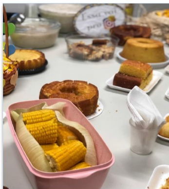
Comidas típicas não faltaram no walk-thru junino

A unidade se reinventou e criou o "Walk-Thru São João contra a Covid-19", onde os colaboradores, devidamente paramentados e caracterizados, escolhiam e retiravam suas guloseimas típicas para se deliciar de maneira segura nas copas e no refeitório do