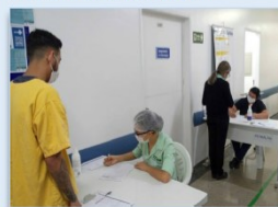
De forma organizada, os colaboradores eram atendidos