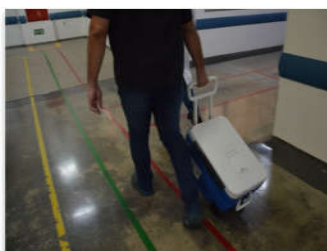
No Huapa, a captação beneficiou cinco pessoas no total

A cirurgia durou cerca de 4h e envolveu uma equipe composta por profissionais do Estado de Goiás. O fígado foi o primeiro órgão a ser retirado. Em seguida, os rins foram captados e, por último, as córneas. Cada órgão e tecido captados já estavam destinados aos seus receptores,