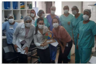
Time da segurança do paciente durante as capacitações, no Huapa