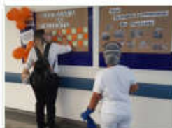
Os colaboradores puderam expor suas ações que garantem a segurança do paciente