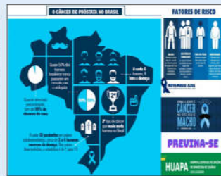
Wallpaper que será utilizado nos computadores da unidade até o fim do mês

Os murais espalhados pela unidade também vão expor materiais informativos sobre a temática. Para a diretoria da unidade, qualquer forma de reforçar a importância de se cuidar, é válida. "Por estarmos no meio de uma pandemia, essa foi uma das maneiras que encontramos de alertar os nossos colaboradores sobre a doença, que é o tipo de câncer mais frequente entre os homens brasileiros, depois do câncer de pele", destacou a diretora geral da