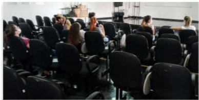
As atividades voltaram a ser realizadas no auditório da Huapa

amplo, precisou ser adaptado para poder ser reaberto. "As cadeiras foram identificadas para o distanciamento ser respeitado, além da disponibilização de álcool em gel em todos os dispensers instalados dentro do auditório. Quem frequentar, também, precisará usar obrigatoriamente a máscara durante todo o tempo de permanência no local. Vale lembrar que tanto o SCIH, quanto o SESMT, farão rondas para monitorar o uso do auditório, por isso precisamos ter esse cuidado", frisou a diretora