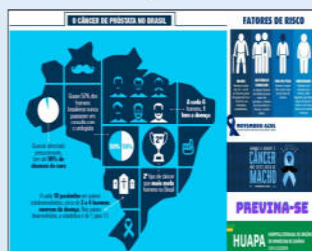
Wallpaper que será utilizado nos computadores da unidade até o fim do mês

Os murais espalhados pela unidade também vão expor materiais informativos sobre a temática. Para a diretoria da unidade, qualquer forma de reforçar a importância de se cuidar, é válida. "Por estarmos no meio de uma pandemia, essa foi uma das maneiras que encontramos de alertar os nossos colaboradores sobre a doença, que é o tipo de câncer mais frequente entre os homens brasileiros, depois do câncer de pele", destacou a diretora geral da