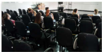
As atividades voltaram a ser realizadas no auditório da Huapa

amplo, precisou ser adaptado para poder ser reaberto. "As cadeiras foram identificadas para o distanciamento ser respeitado, além da disponibilização de álcool em gel em todos os dispensers instalados dentro do auditório. Quem frequentar, também, precisará usar obrigatoriamente a máscara durante todo o tempo de permanência no local. Vale lembrar que tanto o SCIH, quanto o SESMT, farão rondas para monitorar o uso do auditório, por isso precisamos ter esse cuidado", frisou a diretora