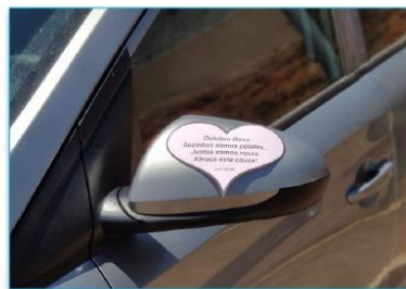
Os carros estacionados no Heapa também entraram na campanha do Outubro Rosa