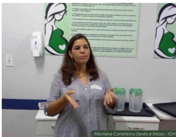
Marilane Correntino (texto e fotos) – IGH

Contamos com a colaboração de todos para garantir um ambiente seguro e acessível para quem mais precisa. Vamos trabalhar juntos para proporcionar o melhor atendimento possível. Obrigado pela compreensão e compromisso!