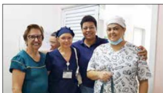
Colaboradoras do HEMNSL recebem brindes