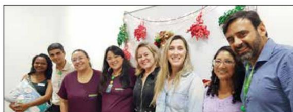
Diretoria do HEMNSL prestigia encerramento do curso