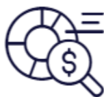
DRG – Diagnosis Related Groups