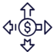
Gestão Estratégica de Custos