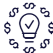
Simulação Orçamentária Inteligente