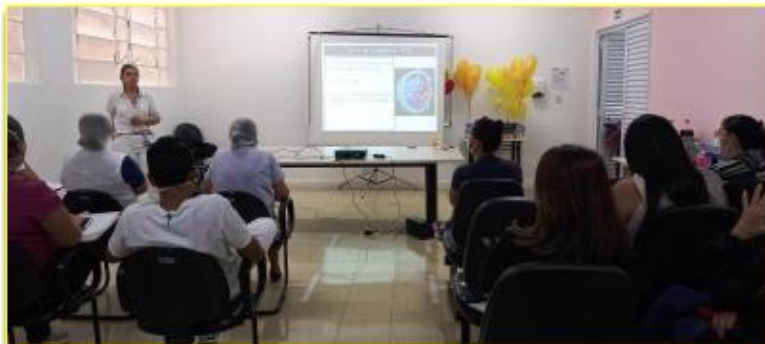
Importantes atividades e palestras foram realizadas no HEMNSL, envolvendo os colaboradores, com foco na qualidade e segurança do paciente