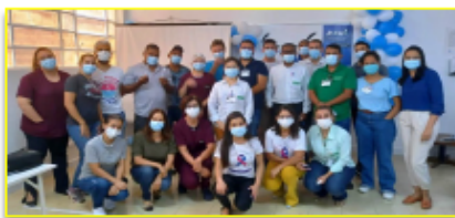
HEMNSL unido em prol da conscientização sobre a saúde do homem