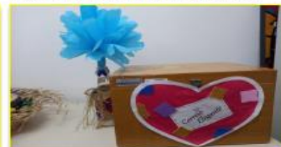
Correio elegante com elogios agitou a galera