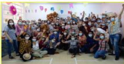
Colaboradores festejam São Pedro com muita animação

Tanto a iniciativa do correio elegante com elogios, bem como o colorido e animação do arraiá contagiaram a todos os participantes.