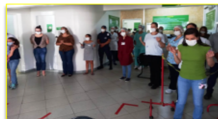
Colaboradores renovam a fé e esperança através da oração