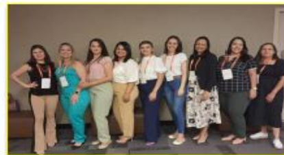
As colaboradoras do HEMNSL posaram para um registro durante o evento