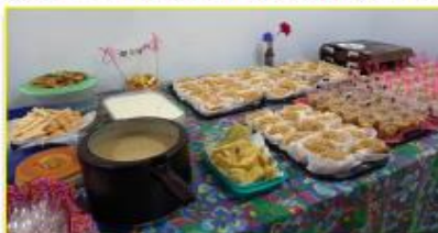
Comidas típicas saborosas no Arraiá da Lourdinha