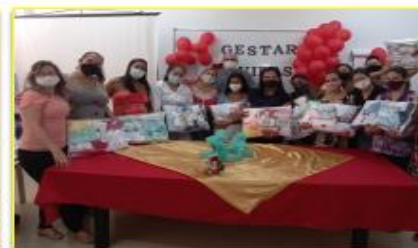
As 10 gestantes presentes no encerramento com seus kits de enxoval