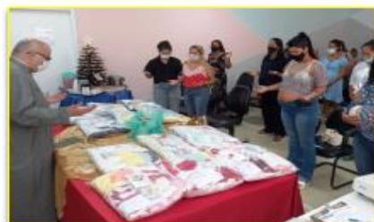
Momento de fé e oração no encerramento da 108ª edição do curso Gestar Vidas