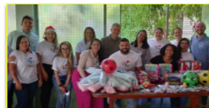
Colaboradores do HEMNSL e empresa parceira se uniram em prol da solidariedade