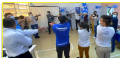
Momento de alongamento para estimular o cuidado com a saúde