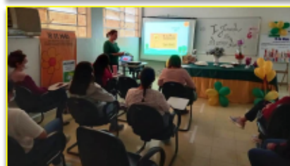
Temas pertinentes foram destaque na I Jornada do Serviço Social do HEMNSL