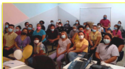
Colaboradores aderem à campanha Setembro Amarelo

Segundo a Organização Mundial de Saúde (OMS) a cada 40 segundos, uma pessoa comete suicídio, no mundo. No intuito de alertar e conscientizar os colaboradores sobre a questão do suicídio bem como os sinais de cautela, o HEMNSL, por meio do Núcleo Hospitalar de Epidemiologia (NHE), promoveu uma palestra no auditório da unidade.