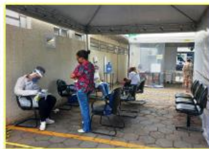
Todo o processo foi realizado com qualidade e segurança