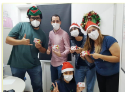
Turma cheia de estilo alegrou o ambiente

A chegada das festas natalinas traz consigo a renovação da esperança, solidariedade, fé e amor. No Hospital e Maternidade Nossa Senhora de Lourdes (HEMNSL), essa magia que envolve o