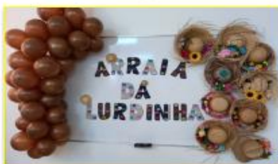
A festança no HEMNSL é tradição

Voltado para os funcionários da unidade, o evento contou com comidas típicas – canjica, pamonha, arroz doce, cuscuz, cachorro quente, pipoca, bolo de milho, bolo de fubá, pé de moleque, paçoca, sucos entre outras delícias; casamento caipira e até dança de quadrilha improvisada.