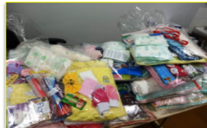
Dentre os itens, sapatinhos, luvinhas, produtos de higiene e fraldas compõem os kits