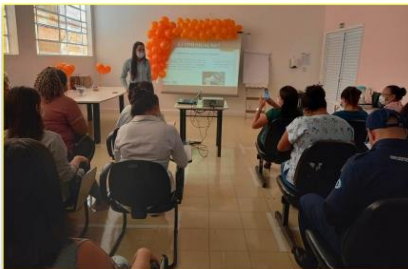
Palestra sobre Comunicação assertiva na campanha Abril pela segurança do Paciente

A comunicação clara e objetiva produz os efeitos esperados, com baixos índices de erros, obtendo o resultado esperado entre os seus colaboradores, com empatia e assertividade”, afirmou a