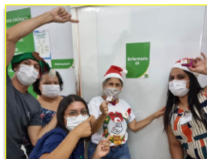
Mensagens de amor e esperança foram levadas às enfermarias