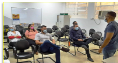
Membros da CIPA passam por treinamento

como Legislação previdenciária, a NR32 (normativa que regula os serviços de saúde), doenças ocupacionais, equipamentos de proteção individual, doenças sexualmente transmissíveis, inspeção de ambiente de trabalho, NR5, entre outros.