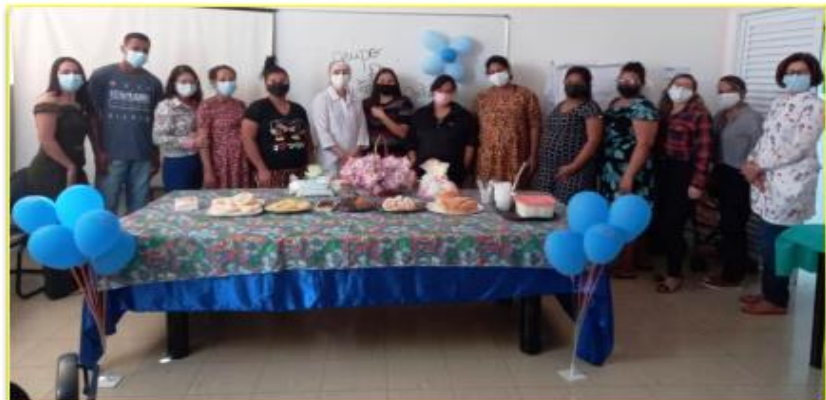
Profissionais da Maternidade com as gestantes participantes do curso

A fonoaudióloga orientou a não deixar as mamas cheias, se encher muito deve colocar o bebê para mamar ou fazer a ordenha, para evitar mastite. Ela explicou