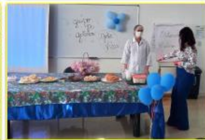
O Aleitamento Materno foi um importante assunto discutido no HEMNSL.