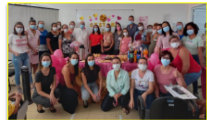
Equipe da maternidade recepciona as novas integrantes do grupo Gestar Vidas