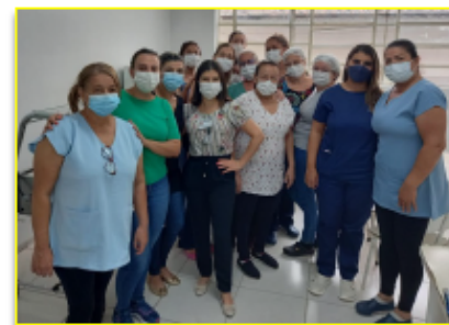
Equipe de enfermagem recepcionou as três novas colaboradoras