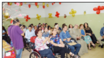
Colaboradores da MNSL e convidados celebram mais um ano de trabalho em prol dos pacientes