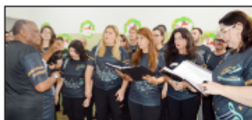
Coral do TCM entoou cânticos natalinos durante a comemoração de fim de ano da Maternidade