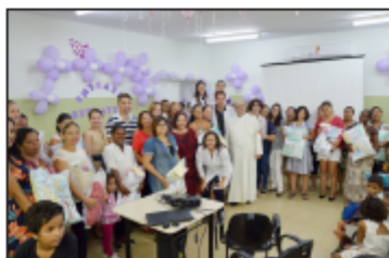
Encerramento do último curso Gestar Vidas, em novembro de 2017

A partir do dia 27 de março, o HEMNSL abre as portas para as gestantes e seus companheiros participarem de mais uma edição do curso Gestar Vidas. Realizado sempre às terças-feiras, no auditório da unidade, as palestras têm o intuito de garantir uma gestação tranquila às futuras mães e esclarecer dúvidas sobre o período gestacional e puerpério. As inscrições são gratuitas e devem ser feitas pessoalmente na Maternidade, sendo que o limite de vagas é para 20 gestantes.