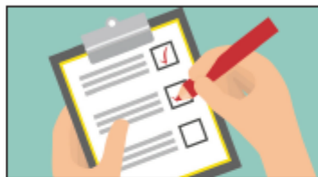
Checklist mostra o passo a passo das informações essenciais para segurança de mães e filhos