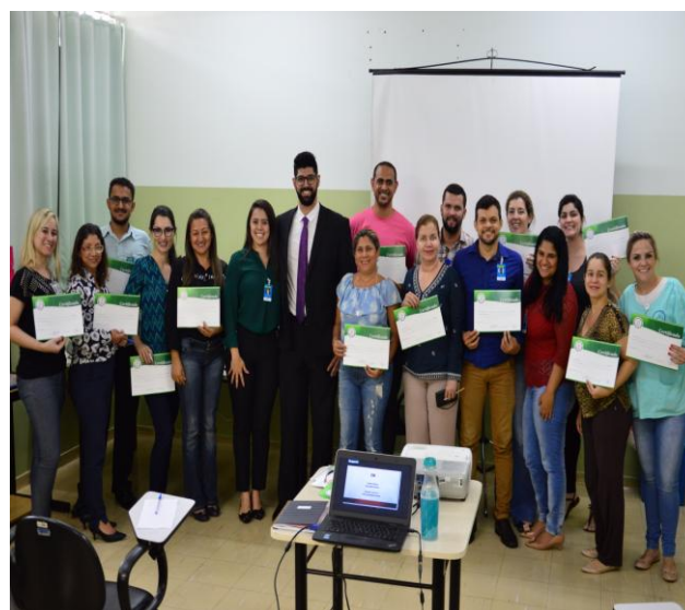
Gestores e líderes se reuniram para registro após a palestra no HEMNSL.