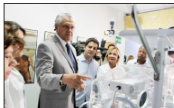
Governador Ronaldo Caiado durante a entrega dos equipamentos

“Esses berços e incubadoras vão suprir muito a demanda do hospital e qualificar a assistência. Estamos trabalhando para trazer resultados a nossa população, e essa entrega é um prova do nosso empenho. O secretário tem uma participação decisiva nesse benefício, pela agilidade com que obteve a verba”, comentou o governador. Os equipamentos foram adquiridos com recursos do Governo Federal. Ronaldo Caiado disse ainda que haverá mais benefícios, para ampliar o atendimento e melhorar a estrutura, com