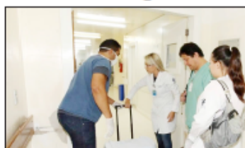
Em uma única doação, seis vidas foram salvas

Após quase sete horas de cirurgia, foram captados com sucesso, coração, fígado, rins e córneas de uma jovem doadora de 24 anos que teve morte encefálica, após sofrer uma eclampsia, no dia 3 de fevereiro. Em ação conjunta com a Central Estadual de Notificação e Captação e Transplantes de Órgãos, da Secretaria de Estado da Saúde (SES), o HMI recebeu equipes de São Paulo e Brasília, para fazer a retirada dos órgãos e encaminhá-los aos seis receptores. O coração, primeiro órgão removido, foi encaminhado para São Paulo e já está transplantado