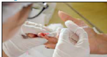
Com o teste, em menos de 30 minutos é possível saber se a gestante possui alguma das duas doenças

Profissionais de enfermagem e residentes em Enfermagem Obstétrica do HMI participaram em 20 de fevereiro de curso prático sobre o manuseio do teste rápido de HIV e Sífilis em gestantes da unidade, promovido pelo Núcleo de Vigilância Epidemiológica Hospitalar (NVEH) e Gerência de Enfermagem. A proposta foi explicar sobre como proceder ao detectar as doenças em discussão, de forma que garanta a segurança e bem estar tanto da mãe quanto do bebê. Ministrada pelos coordenadores do Pronto Socorro da Mulher (PSM), Centro Cirúrgico e Clínica de Ginecologia e Obstetrícia, a aula contou com explicações sobre como utilizar os kits dos testes rápidos, a diferença entre eles, utilização