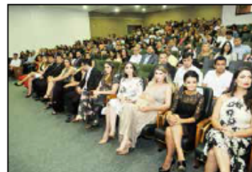
Festividades marcam mais uma etapa profissional dos residentes