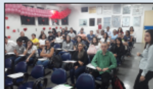
Novos colaboradores recebem treinamento

A integração é de caráter multidisciplinar, e contou com a participação de vários setores como Recursos Humanos, Comissão de Controle de Infecção Hospitalar (CCIH), Núcleo de Vigilância Epidemiológica (NVE), Serviço Especializado em Engenharia de Segurança e em Medicina do Trabalho (SESMT), Tecnologia da Informação e outros serviços essenciais para a formação dos novos integrantes do hospital.