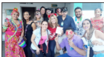
Bloquinho levou alegria e informação