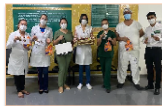
Gerência e coordenações de Enfermagem para distribuição de bombons e brindes

com dedicação, carinho e humanização. Queremos que saibam o quanto são importantes e valorizados", completou.