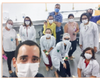
Gerência e coordenações de Enfermagem para distribuição de bombons e brindes

A iniciativa foi do médico Assuero Seixas, coordenador do Núcleo Interno de Regulação (NIR) do hospital, com parceria da empresa Sablé Patisserie , como forma de agradecer a todos pela dedicação e os cuidados preventivos adotados nas áreas assistenciais e administrativas contra o coronavírus. "Quis manifestar minha gratidão e apreço a