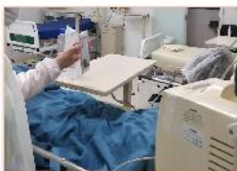
Uma profissional de Psicologia sempre acompanha todo processo da visita virtual

Implementado pelo setor de Psicologia, através de seus profissionais que acompanham de perto os pacientes, o projeto é uma forma de aproximação do paciente com sua rede de suporte social. As chamadas de vídeo são realizadas duas vezes na semana para os pacientes acordados e conscientes. A