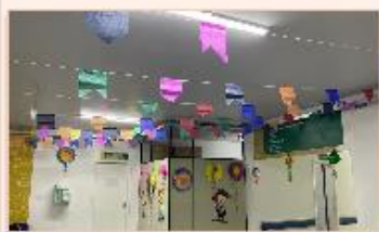
Ambiente do HMI ganha colorido especial com decoração junina

O clima junino tomou conta do hospital no mês de junho. Bandeirolas, balões, ilustrações de caipirinhas e chapéus se destacaram nos corredores, recepção e sala de espera da unidade.