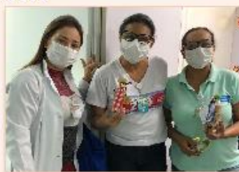
Colaboradoras felizes com a atenção e carinho recebidos

"A festa junina é tradicional e o colorido da decoração, além de humanizar o ambiente hospitalar, traz descontração e alegria aos colaboradores e pacientes. São pequenos gestos de solidariedade e atenção que faz com que sejamos mais unidos e nos proporcionam momentos de alegria", pontuou a psicóloga Flávia Zenha.