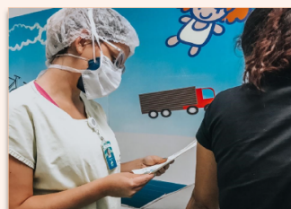
Psicóloga entrega carta à mãe enlutada