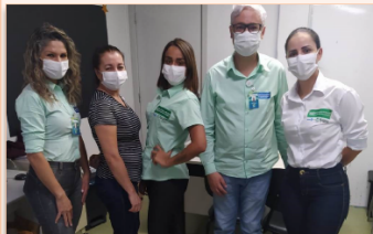
Qualificação contínua faz parte dos processos do HMI

Atento ao atendimento humanizado e acolhimento de seus pacientes, o hospital realiza de forma contínua a requalificação de seus profissionais. Com o objetivo de manter a prevenção, o controle e a contenção de riscos em função da pandemia do novo coronavírus, bem como a orientação para a realização de procedimentos seguros em caso de assistência a pacientes acometidos pela Covid-19, a unidade segue com o treinamento de "Higienização das mãos, Paramentação e Desparamentação EPI – COVID-19", dos multiprofissionais que atuam na área de assistência.