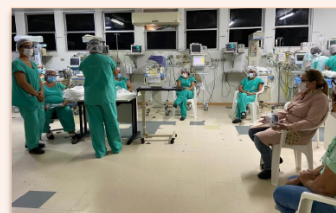
Profissionais da Ucin recebem o treinamento sobre procedimentos seguros a pacientes com Covid-19