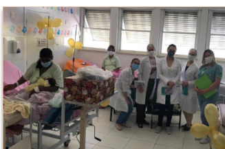
Ação lembra a importância do aleitamento materno, lembrado sempre no mês de agosto

O leite materno é o primeiro alimento da vida. É através dele que o corpo se desenvolve e é fortalecido, para que as mais variadas doenças sejam prevenidas. Por isso, o Banco de Leite Humano (BLH) do Materno-Infantil,