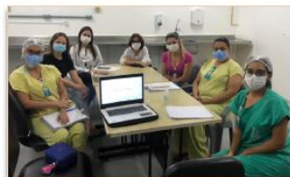
Profissionais da Psicologia recebem o treinamento

Em uma unidade de saúde, principalmente de média e alta complexidade como o HMI, são frequentes quadros delicados de doenças, cirurgias de alto risco, diagnósticos inesperados e, às vezes