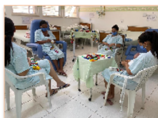
A produção dos palhacinhos distrai as mães que estão acompanhando seus bebês na Ucin