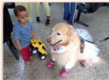
Pet terapeuta chamou a atenção do pequeno paciente