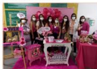
Colaboradores se vestem de rosa em alusão à campanha

para divulgar o jornal do Núcleo de Vigilância sobre as Doenças Epidemiológicas do HMI.