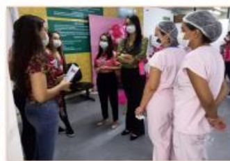
Servidores recebem orientações sobre Câncer de Mama