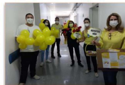
Equipes da Cipa e NVEH em ação