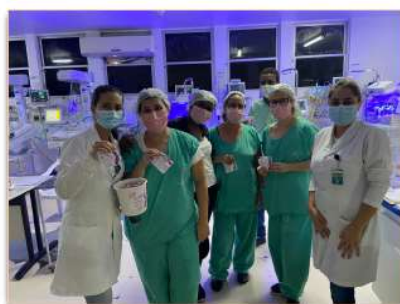
Equipe da UCIN recebe orientações sobre Hanseníase

A hanseníase é conhecida como uma das doenças mais antigas da humanidade. E apesar de ter cura, ainda é um problema grave de saúde pública no Brasil. No último domingo do mês de janeiro é comemorado o Dia Mundial contra a Hanseníase e, durante todo o mês, são promovidas ações educativas