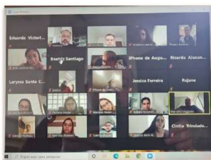
Recepção virtual aos novos residentes do HMI

O HMI recepcionou os novos residentes, no dia 1º de março, de uma maneira diferente. Devido ao momento de pandemia e seguindo os protocolos designados pelo Ministério da Saúde, o acolhimento foi virtual. Ao todo, 23 novos residentes deram início a um novo ciclo de aprendizado. Eles devem permanecer de dois a três anos em atuação dentro do