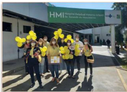
HMI adere a campanha Julho Amarelo

Em alusão ao Dia Mundial de Luta contra as Hepatites Virais, lembrado em 28/07 e ao Julho Amarelo, campanha nacional de combate à doença, o hospital promoveu, no dia 29 de julho, uma ação junto aos colaboradores.