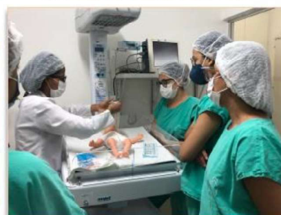
As aulas práticas foram ministradas por uma equipe multidisciplinar do HMI