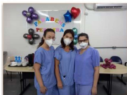
Pediatras da UTI do Materno Infantil

No dia 27 de julho é comemorado dia do Pediatra. E o HMI, maior hospital de referência no atendimento infantil do Estado de Goiás, não poderia deixar a data passar em branco e homenageou seus os seus profissionais com um café da manhã especial, como agradecimento à atenção por eles dada arduamente todos os dias aos pequenos pacientes.