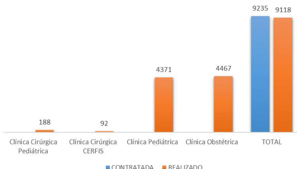
Gráfico 1- Saídas hospitalares 2021.

Foram realizadas um total de 9.118 saídas hospitalares, frente às 9.235 contratadas. Atingindo 99% da meta anual, ficando entre a variação aceitável de 10%.