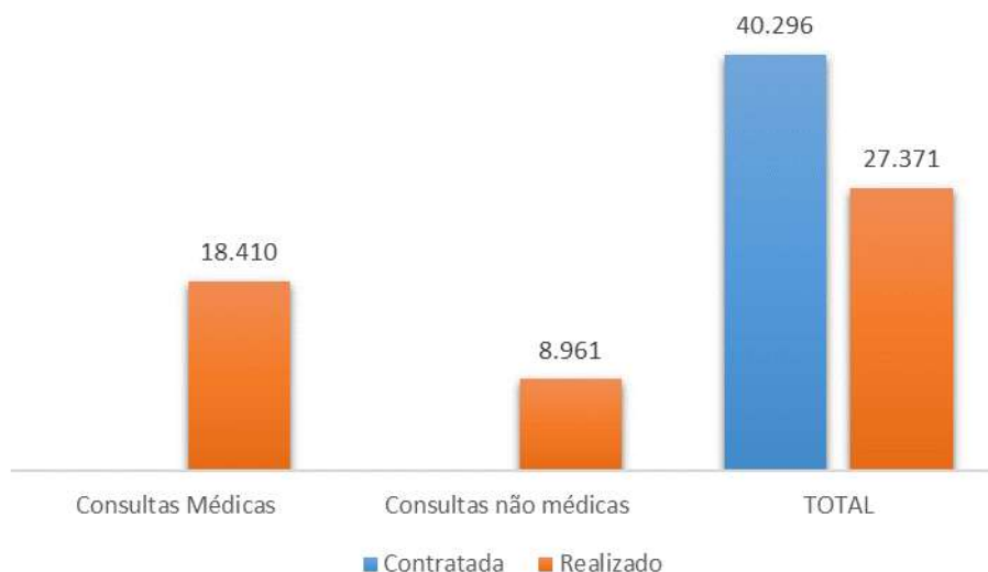
Gráfico 3- Atendimento ambulatorial 2021.

Foram realizados um total de 27.371 atendimentos ambulatoriais, frente aos 40.296 contratados. Cumprindo 68% da meta anual, e ficando abaixo da variação aceitável de 10%.