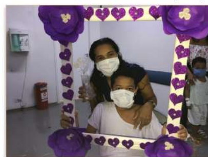
Mãe de paciente internado elogiou a homenagem

pezinhos das crianças internadas na Unidade de Terapia Intensiva (UTI) Neonatal, na UTI Pediátrica e da Unidade de Cuidado Intermediário Neonatal (Ucin).