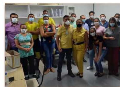
Colaboradores do HMI participam de ações em prol do Setembro Amarelo