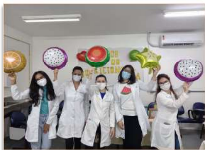
Equipe de nutricionistas do HMI

Para marcar o Dia do Nutricionista, comemorado em 31 de agosto, o Hospital Estadual Materno Infantil Dr. Jurandir do Nascimento (HMI) preparou uma tarde bem animada para os colaboradores da unidade. As atividades foram bastante dinâmicas.