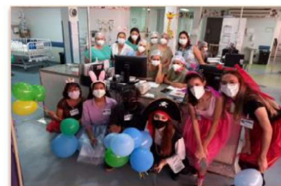
A tarde foi inesquecível durante o dia especial para as crianças, com muitos presentes e alegria