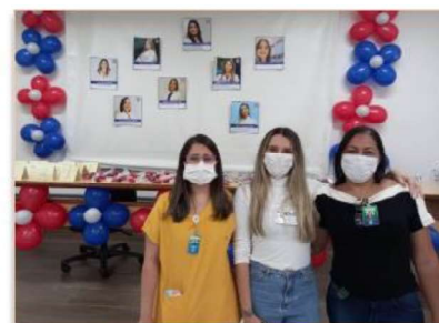
Equipe de fonoaudiologia do período vespertino do HMI

Os profissionais de fonoaudiologia do Hospital Estadual Materno Infantil Dr. Jurandir do Nascimento (HMI) tiveram uma comemoração especial, em 9 de dezembro - Dia do Fonoaudiólogo. Durante todo o dia, os profissionais desenvolveram atividades no auditório da unidade, que recebeu uma decoração especial. Um painel com fotos das oito fonoaudiólogas que trabalham na unidade foi instalado.