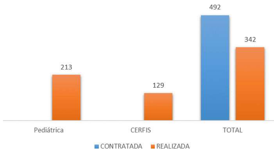
Gráfico 2-Cirurgias eletivas 2021.

Foram realizadas um total de 342 cirurgias eletivas, frente às 492 contratadas. Atingindo 70% da meta anual, ficando abaixo da variação aceitável de 10%.