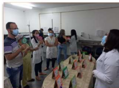
Colaboradores do hospital também participaram do jogo de “Mitos e Verdades”