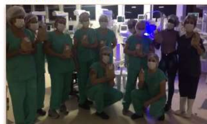
Colaboradores da UCIN com seus kits de Páscoa