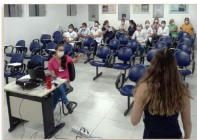
Colaboradores participam de curso do IHAC

O Comitê Interno de Aleitamento Materno da unidade promoveu nos dias 17, 18 e 19 de novembro, o curso de atualização da Iniciativa Hospital Amigo da Criança (IHAC), no auditório do hospital.