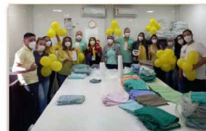
Abordagem também foi realizada no setor da lavanderia