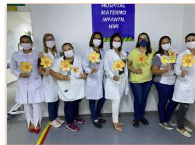
As equipes do HMI envolvidas na ação