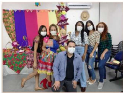
Colaboradores do RH vestidos a caráter