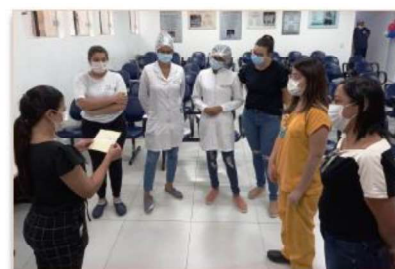
Servidores da Nutrição e Qualidade participam das brincadeiras