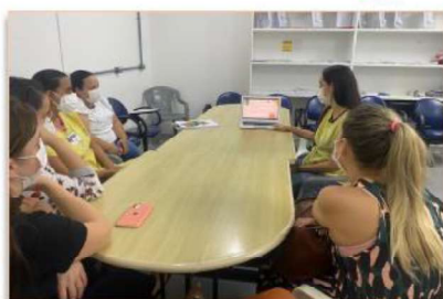
Psicólogos participaram do curso de Educação Continuada

Uma das áreas em que o profissional de psicologia atua, onde existe demanda crescente, é a área hospitalar. Por meio de uma Educação Continuada, o Hospital Estadual Materno-Infantil Dr. Jurandir do Nascimento (HMI) proporciona a seus profissionais, capacitações e atualizações com o objetivo de melhorar