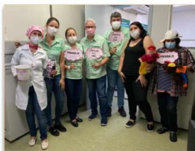
Recepcionistas são informados da importância do uso de preservativo

De forma divertida, a equipe do NVEH passou em todos os setores da unidade, orientando e reforçando a importância da prevenção, além de distribuir preservativos masculinos e femininos, balas e folhetos informativos sobre as ISTs, dentre elas HIV, sífilis e as hepatites virais.