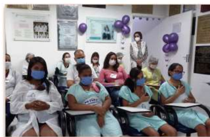
Mães utilizam o Método Canguru com seus bebês