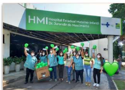
Equipe do HMI na campanha do Setembro Verde

De acordo com o Ministério da Saúde, atualmente, no Brasil, 53.218 pessoas estão na fila de espera aguardando um transplante. No intuito de incentivar a doação de órgãos, o HMI, por meio da Comissão Intra-Hospitalar de Doação de Órgãos e Tecidos para Transplantes (CIHDOTT), desenvolveu algumas ações, nos dias 27 e 28 de setembro, com apoio dos setores de Psicologia e Serviço Social.