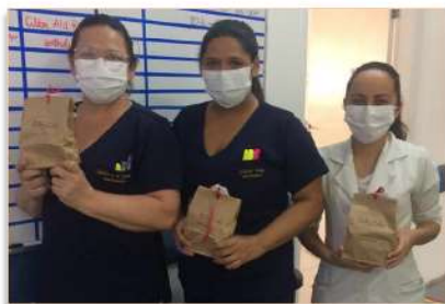
Surpresas gostosas alegraram as profissionais

Os colaboradores do HMI que estavam de plantão no dia 3 de abril foram surpreendidos com uma deliciosa surpresa: uma doação de lanches em comemoração à Páscoa.