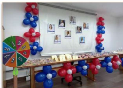
Com fotos das profissionais, o auditório ficou especialmente decorado