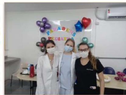
Pediatras residentes felizes com a homenagem