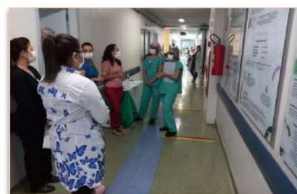
Grupo de colaboradores ouvem sobre as diretrizes do IGH