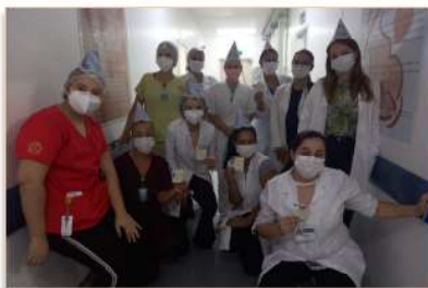
Equipe se sensibiliza e incentiva uns aos outros

passado, com a Covid-19. Ela venceu a doença, mas ainda tem muito medo.