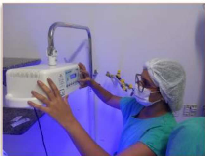
A fototerapia utiliza a ação da luz para o tratamento da icterícia neonatal