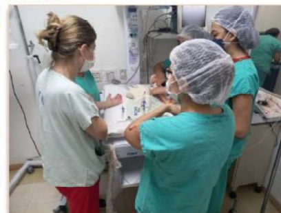
Durante a capacitação, os participantes aprenderam como mexer no aparelho