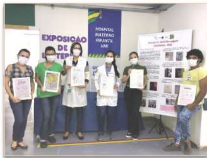
A programação da Semana de Enfermagem contou a exposição de lettering

Para comemorar o Dia do Enfermeiro, do Técnico e Auxiliar de Enfermagem, celebrados nos dias 12 e 20 de maio, e também o Dia Mundial da Higiene das Mãos, lembrado no dia 5 de maio, o hospital realizou uma programação repleta de homenagens e criatividade para os seus colaboradores.