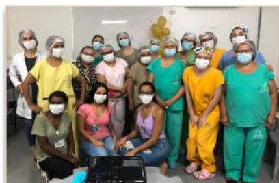
Equipe multidisciplinar da UCIN e UTIN

Visando uma assistência de melhor qualidade e humanizada, foi realizada em 7 de outubro, uma oficina de Manuseio Mínimo aos profissionais