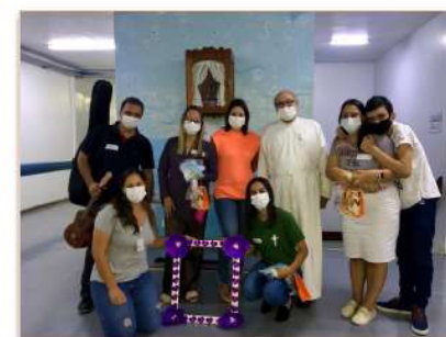
As equipes de Psicologia e Serviço Social foram as responsáveis pela ação