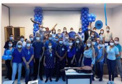
Cor azul predominou nas vestimentas dos servidores, que registraram esse momento especial