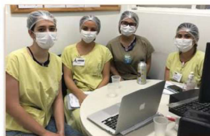
Profissionais do período vespertino atentos à capacitação

Em unidades hospitalares o psicólogo atua em quadros delicados de doenças, diagnósticos inesperados, cirurgias de alto risco e também em casos de falecimento de entes queridos. Ele age como um facilitador no processo das despedidas. “Essa assistência é fundamental. Temos que estar preparados para acolher, apoiar e sustentar emocionalmente a família