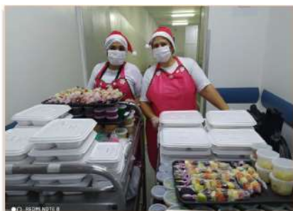
Copeiras em clima de Natal entregam as ceias nos leitos

Para minimizar a distância dos familiares e proporcionar lembranças de bons momentos, o Hospital ofereceu aos pacientes um cardápio especial para a ceia e almoço de Natal e Ano Novo.