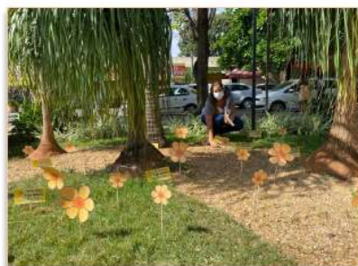
O jardim da frente da unidade foi decorado com flores

Para marcar o 18 de maio, Dia Nacional de Combate ao Abuso e à Exploração Sexual contra Crianças e Adolescentes, o Hospital Estadual Materno-Infantil Dr. Cairo Louzada (HMI) realizou uma ação para conscientizar pacientes e colaboradores sobre a data.