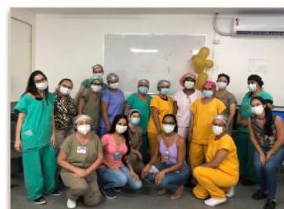
Segunda turma do curso de Manuseio Mínimo

de sono, além de reduzir seu gasto energético e o estresse.