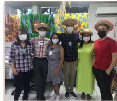
Equipe do NIR entrou na festa