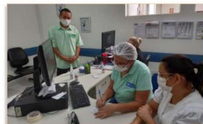
Equipes do Crie e Distrito Campinas-Centro colaboraram com a vacinação