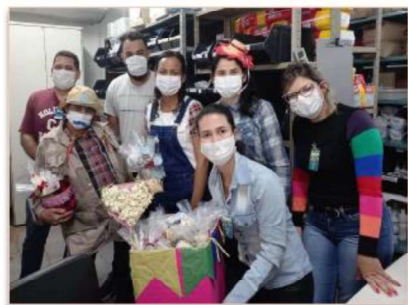
Colaboradores do HMI no clima de São Pedro

Encerrando as comemorações juninas, o Hospital Estadual Materno-Infantil Dr. Jurandir do Nascimento (HMI), por meio do Núcleo de Vigilância Epidemiológica Hospitalar (NVEH),