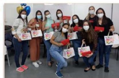
A equipe de Psicologia posam felizes, após serem presenteadas, em dia especial