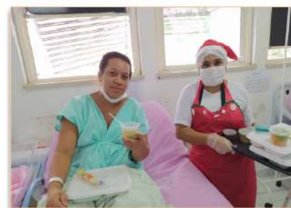
Paciente satisfeita com almoço especial de Natal

Para a última noite do ano, o setor de Nutrição do hospital também preparou a ceia de Réveillon e o almoço do dia 1º de janeiro, com menu diferenciado.