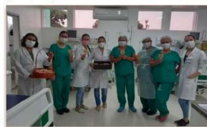
Colaboradoras da UTI Materna são homenageadas pelo dia da mulher