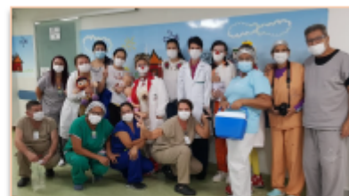
Comemoração ao Dia Internacional de Sensibilização do Método Canguru