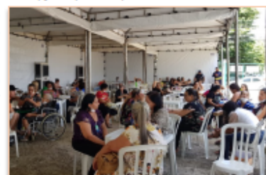
Pacientes passaram por triagem antes de realizar exames e consultas