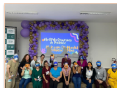
Colaboradoras usaram máscara com tema alusivo a ação sobre Higiene das Mãos e Segurança do Paciente