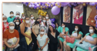
Colaboradores do Hemu com membros do grupo Missão Sorriso